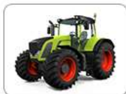
OLEJE DO ROLNICTWA