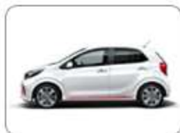
OLEJE DO SAMOCHODÓW OSOBOWYCH