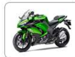
OLEJE DO MOTOCYKLI